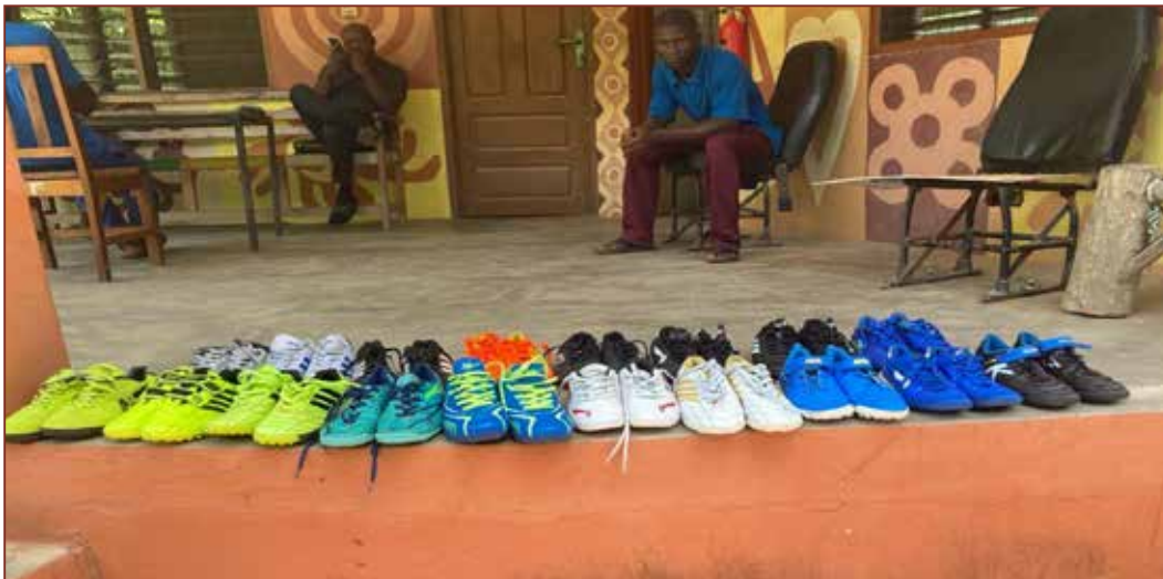
Da 13 Mädchen keine Schuhe haben, kaufen wir gebrauchte Schuhe für sie.

Dafür bezahlen wir im Monat 125 € (die Transportkosten mit öffentlichen Verkehrsmitteln alleine sind schon ca 50 €.)