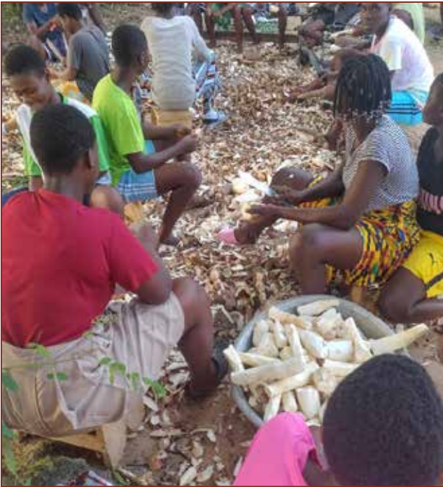
1 Woche lang wurde in der Schule von der Cassava Ernte Gari produziert.