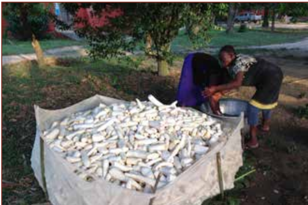
Das geschälte Gari wird gewaschen und dann zur Mühle gebracht um es zu mahlen.