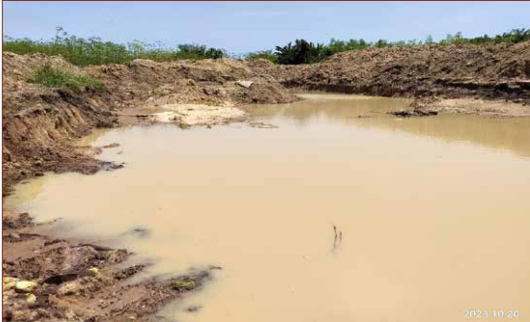
Bevor der Damm fertiggestellt ist, ist er schon voll mit Regenwasser.

Wir danken ganz herzlich der GLS Zukunftsstiftung Entwicklung für die Unterstützung dieser Projekte und für die jahrelange treue Unterstützung unserer Arbeit in Ghana.