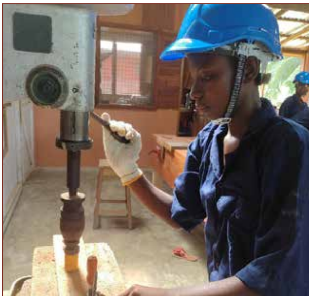
Auch an die Maschinen werden sie rangeführt.

Ganz herzlichen Dank an Koenig & Bauer für die tolle Unterstützung. Auch vielen Dank an die HiddenChampionsGroup, die einen Teil der Aus- stattung für die Mädchen gesponsert haben.