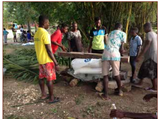
Jetzt wird das Wasser rausgepresst.

Die Familie einer ehemaligen Schülerin war eine Woche lang in der Schule, um zusammen mit den Schüler*innen das Gari herzustellen. 5 große Säcke wurden es, das wird bis ins neue Jahr reichen und uns einiges Geld sparen, da Gari teuer ist.