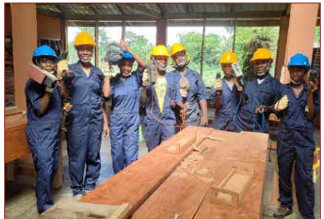
GirlsEmpowerment, stolze Handwerkerinnen.

Ganz herzlichen Dank an Koenig & Bauer für die tolle Unterstützung. Auch vielen Dank an die HiddenChampionsGroup, die einen Teil der Aus- stattung für die Mädchen gesponsert haben.