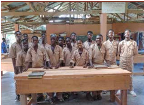
Die Jungen mit den neuen Overalls.