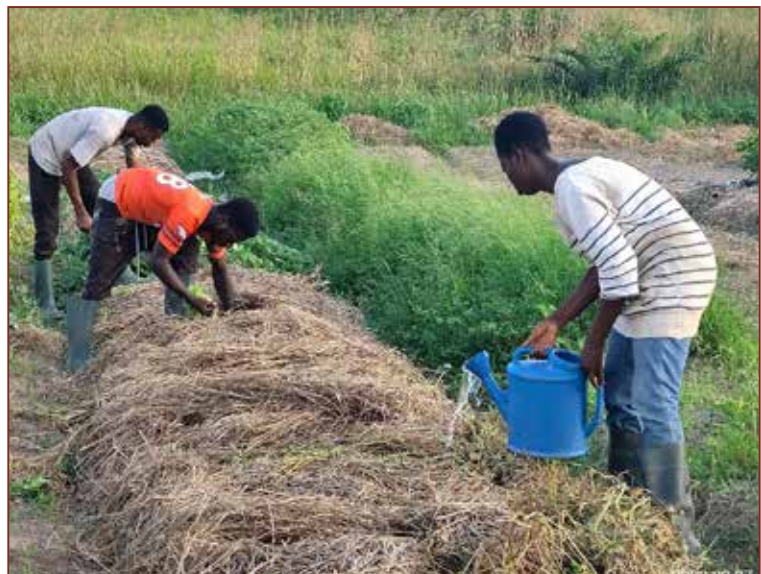
Im Augenblick sind nur 4 Farmer auf der Adepa Farm, 2 davon ehemalige Schülerin_Schüler.

ist immer noch in der Aufbauphase, braucht also eigentlich mehr Input als im Augenblick rauskommt. Das wird aber auch besser werden, da wir im neuen Jahr ca 10 Farmer*innen (ehemalige Schüler*innen) haben werden, die hoffentlich zu einem guten Ergebnis beitragen werden. Im Augenblick haben wir nur 4 Farmer*innen.