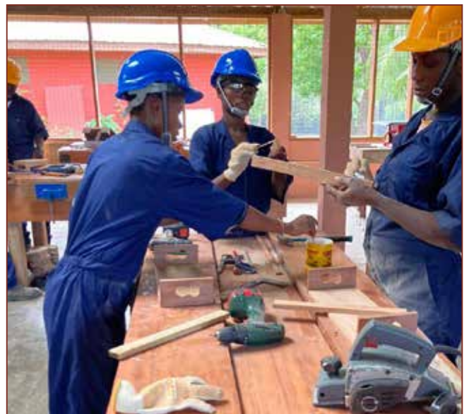
Sie sind sehr engagiert dabei.