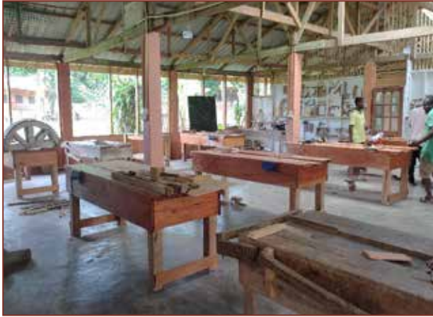
Neue Hobelbänke made by Baobab.