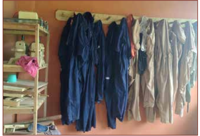
Neue Arbeitsoveralls für Jungen und Mädchen.