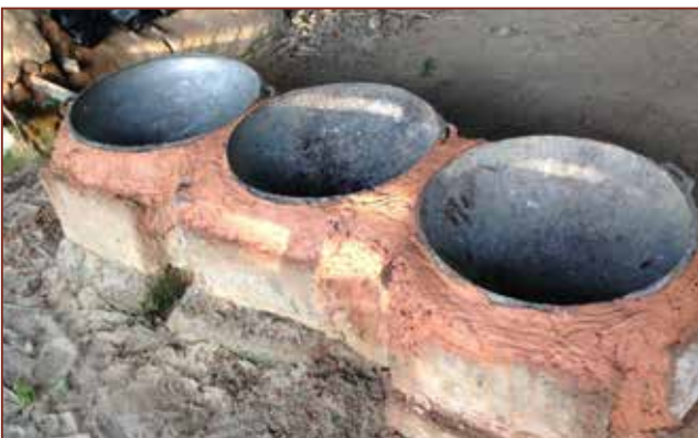
Eine einfache Feuerstelle zum Rösten des Gari wurde von den Frauen aus dem Hinterland gebaut.

Gari wird hergestellt aus Cassava (Maniok), es ist eine Methode Cassava für viele Monate haltbar zu machen. Gari wird bei uns in der Schulküche sehr viel angeboten.