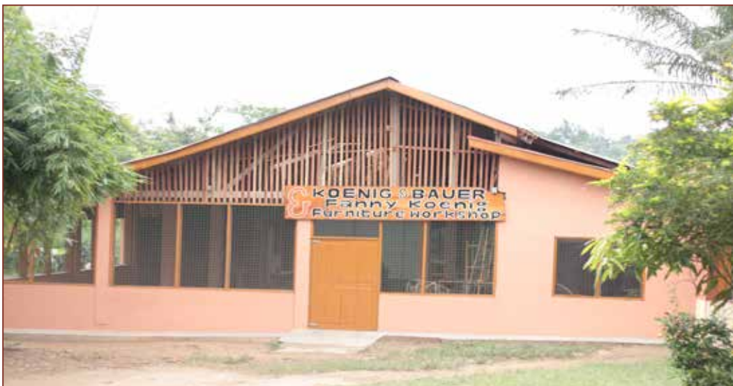
Ausbau und Vergrößerung der Schreinerei.

Das Schreinerei Projekt ist inzwischen fast abgeschlossen: Ausbau der Schreinerei, neue Hobelbänke gebaut von Baobab, Arbeitskleidung und Schuhe für die Jungen, Werkzeuge, Maschinen.