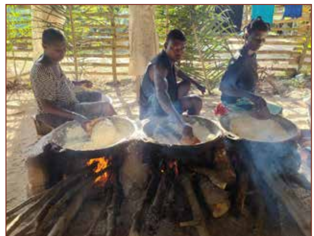
Nun beginnt der aufwendige Prozess des Rösten.