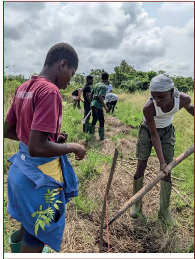
Das Gelände wird für die Baumpflanzung vorbereitet