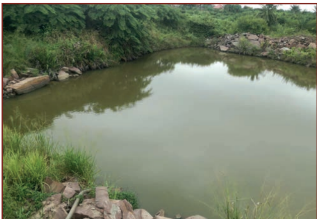
Der Wasserdamm ist jetzt größer, er ist voll und läuft über