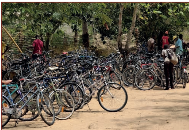
So sieht es nach der Ankunft von einem Container aus