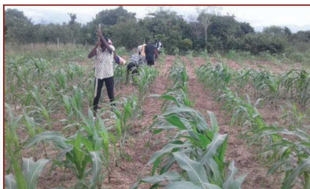
Maispflanzung - Schüler pflanzen Mukunabohne als Zwischenfrucht