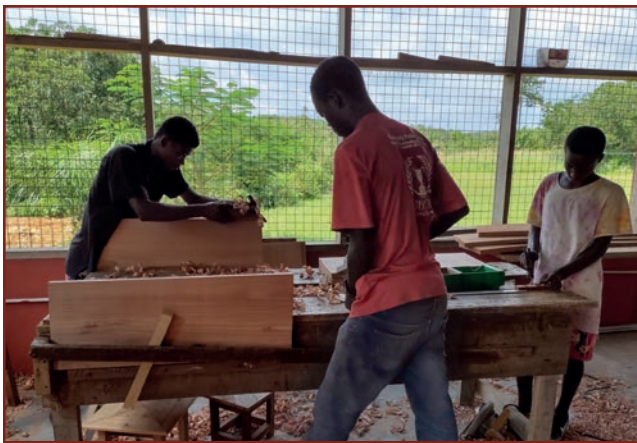
In der Schreinerei