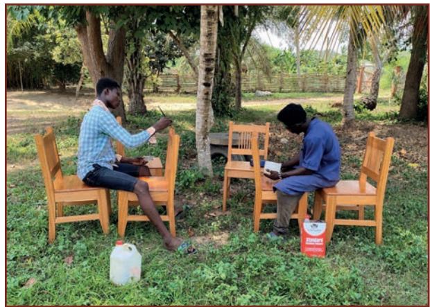
Eine Bestellung von Holzstühlen wird lackiert