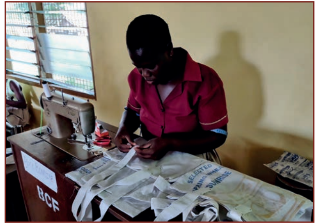
In der Nähwerkstatt werden für jede SchülerIn eine Stofftasche aus Mehlsack genäht um Plastik-