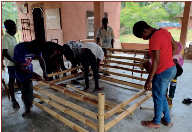
Bau eines Bambusbettes