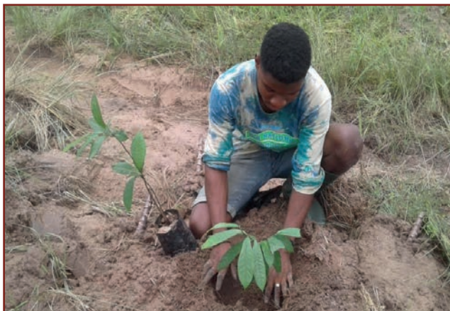
Edem pflanzt einen Baum